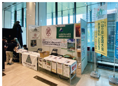
【夏山フェスタ in 福岡】 場所：電気ビルみらいホール 期間：令和5年6月24日（土）～25日（日）