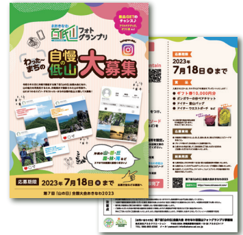
おきなわ百低山 グランプリ作品募集用