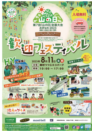
歓迎フェスティバル用