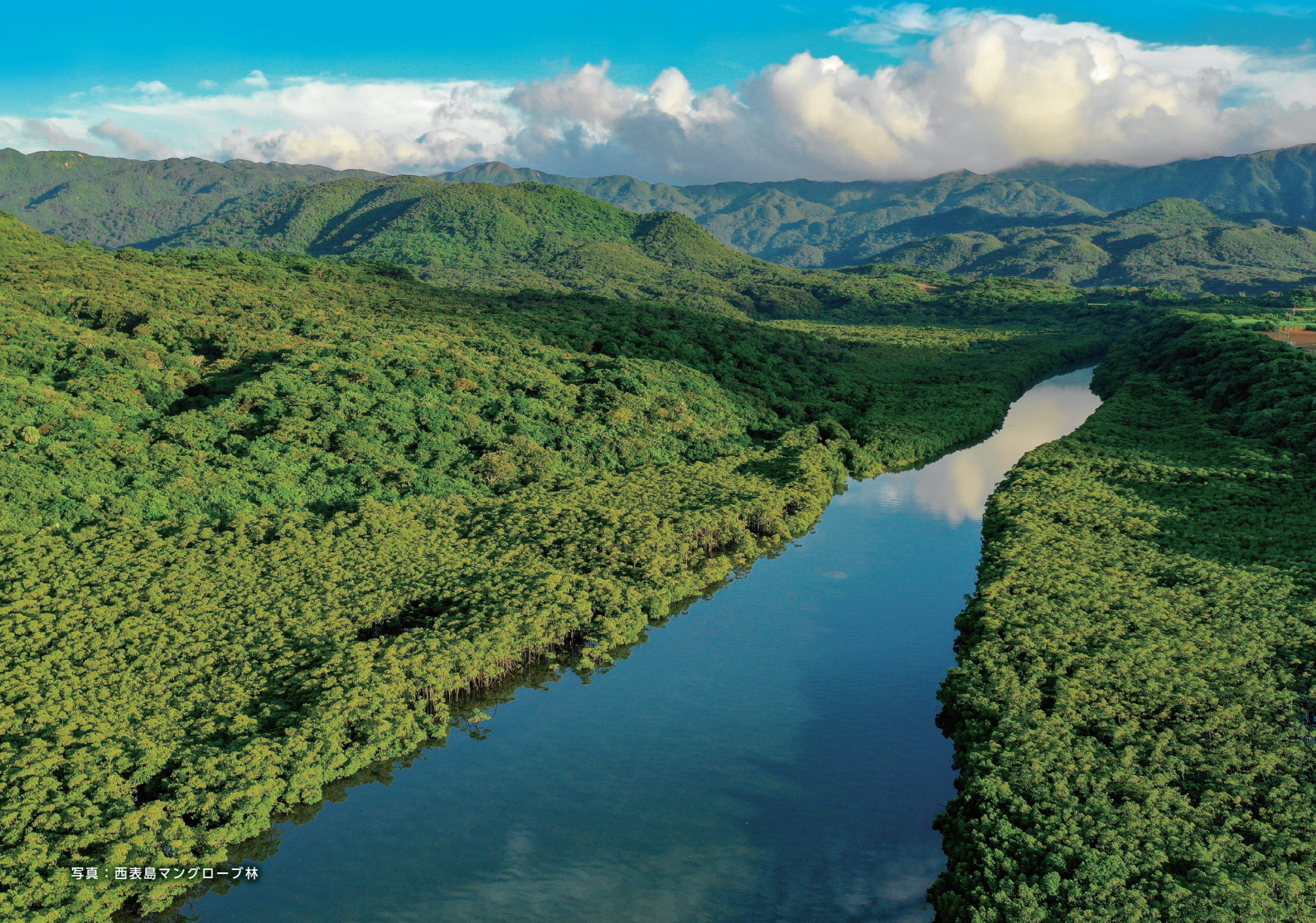
写真：西表島マングローブ林