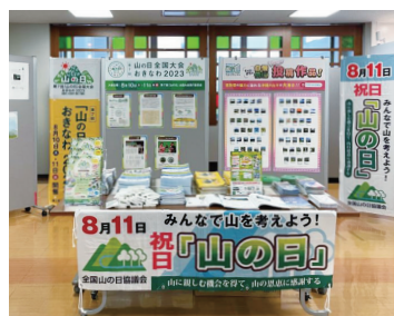
場所： 内閣府沖縄総合事務局ロビー