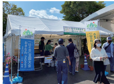
【東村つつじサミット】 場所：東村の村民の森つつじ園 期間：令和5年3月12日（日）