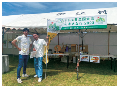
【伊江島ゆり祭り】 場所：伊江村リリーフィールド公園 期間：令和5年4月29日（土）～30日（日）