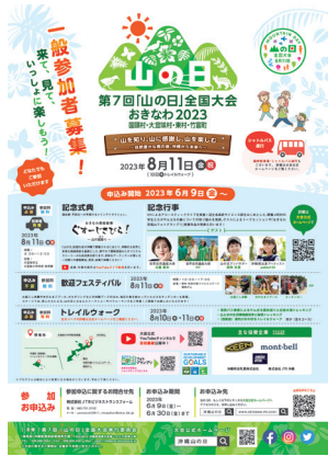
一般参加者募集用