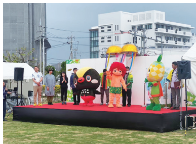
【スタートイベント「奥武山フェス」】 場所：奥武山公園 期間：令和5年3月25日（土）