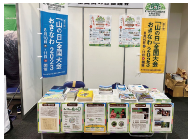
【夏山フェスタ in 名古屋】 場所：愛知県産業労働センター 期間：令和5年6月3日（土）～4日（日）