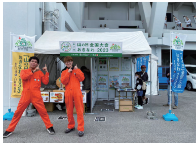
【読売ジャイアンツ那覇キャンプ】 場所：沖縄セルラースタジアム那覇 期間：令和5年2月25日（土）～26日（日）