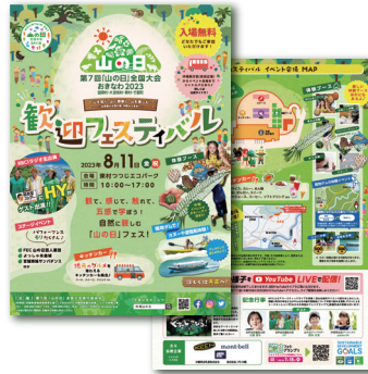
歓迎フェスティバル用