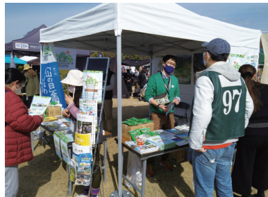
【大阪アウトドアフェス】 場所：万博記念公園 期間：令和5年3月4日（土）～5日（日）