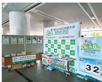
場所： 沖縄県庁 1F ロビー