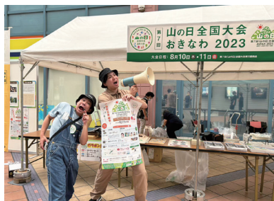
【環境月間街頭キャンペーン】 場所：サンエー那覇メインシティ 期間：令和5年6月10日（金）